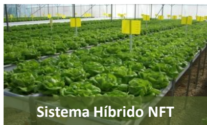
Sistema Híbrido NFT

Desarrollamos nuevos sistemas, mejoramos y evolucionamos los sistemas hidropónicos existentes, haciéndolos más ligeros, más económicos, más fáciles de usar y más estables en su manejo .