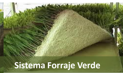
Sistema Forraje Verde