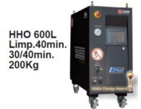
HHO 600L Limp. 40min. 30/40min. 200Kg