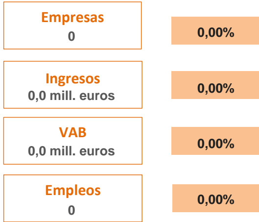
Evolución del VAB y de los Ingresos Agregado, mill. euros (2017-2019)