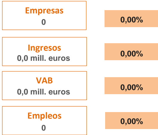
Evolución del VAB y de los Ingresos Agregado, mill. euros (2018-2020)