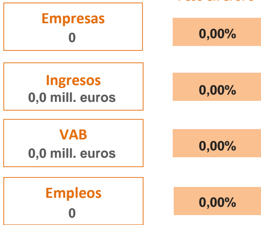
Evolución del VAB y de los Ingresos Agregado, mill. euros (2018-2020)