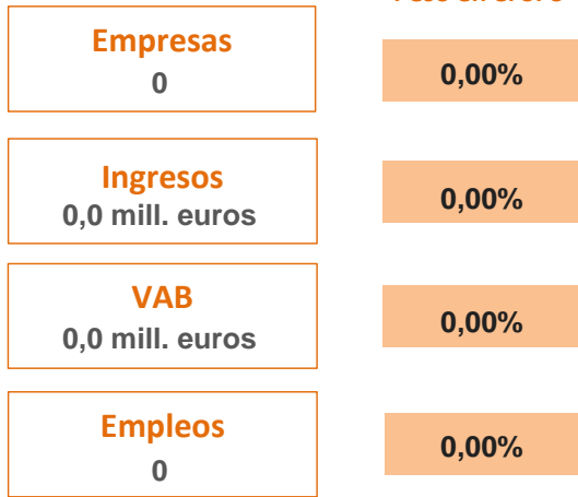
Evolución del VAB y de los Ingresos Agregado, mill. euros (2016-2018)