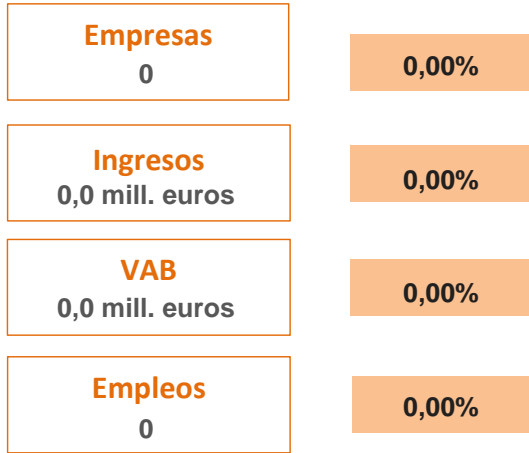
Evolución del VAB y de los Ingresos Agregado, mill. euros (2016-2018)