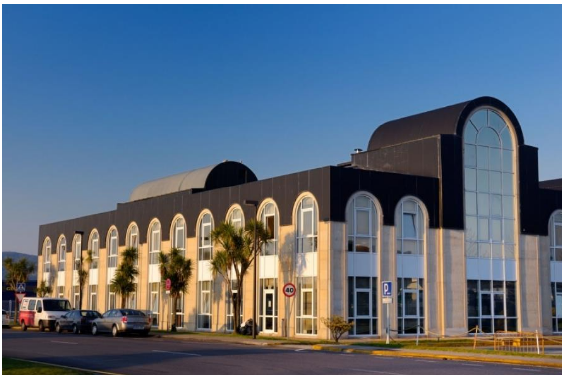
Edificio de oficinas del Consorcio

Al llegar arriba, al fondo, a la derecha, hay un aula donde tendrá lugar la prueba. El llamamiento se hará en el pasillo de acceso al aula (los aspirantes deberán identificarse presentando su DNI).